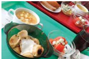
食堂では主にロシア料理が並んでいます。3カ月間飽きることなく美味しくいただきました！

大学を卒業してもずっとロシアとの繋がりを保持したいと思っています。そしてまた劇場に足を運び、ロシアの芸術文化に触れていきたいです。