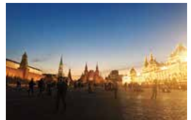
白夜の時期、日が沈む頃の赤の広場は絶景でした。