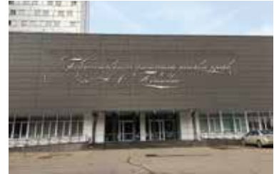
プーシキン大学入り口。校舎は比較的綺麗です。