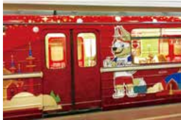
ワールドカップ開催時期のモスクワは非常に盛り上がっていました。メトロの駅や車両までワールドカップ仕様でした。