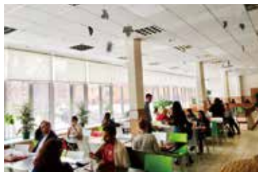
食堂の様子。寮の部屋に戻って昼食をとる人も多い。