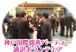
神戸国際親善パーティー 通訳ボランティア

イコトしてるって気持ちがあつたときもあるけど、 今はボランティアしてて楽しい！ 自分も成長できていると感じる。