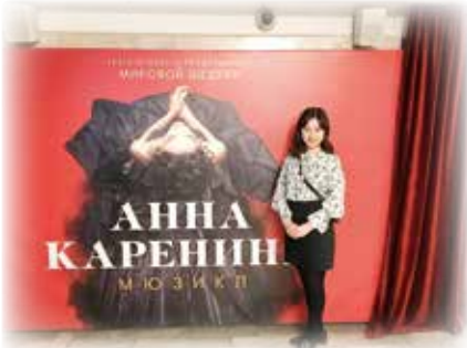
オペレッタ劇場でアンナ・カレリーナのミュージカルを観ました。

国立プーシキン記念ロシア語大学に派遣留学した、ロシア学科4年(留学時3年)の■■■■さんの報告です。