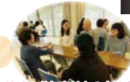
地域のお年寄りとの交流会 陽だまりサロン

障がいのある人達と 触れ合って、自分の中で 新しい気づきがあるの ときに、価値観、空気観の 違いに戸惑うこともある。