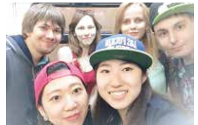
モスクワで出会った友人達とイズマイロフスキー公園に行った帰りに。