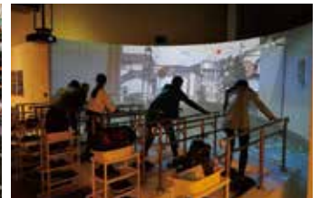
津波避難体験の様子