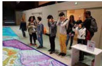
日本周辺海底地形図を 3D メガネで