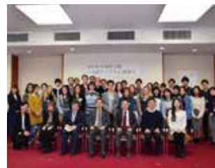
2019 年度春学期開講式

開講式後の歓迎会では、JLP パートナーや先輩留学生のお勧めのお菓子を食べながら、留学生と外大生が自分の趣味や出身国の文化について話し、ビンゴゲームなどを通じて親睦を深めました。