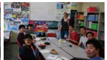
和やかで楽しい雰囲気のイタリア語チャット。