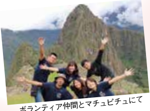
ボランティア仲間とマチュピチュにて