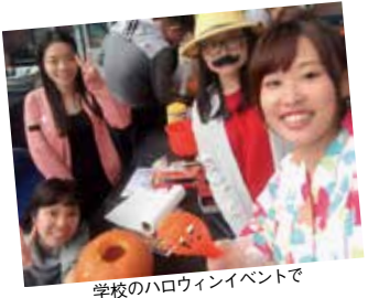
学校のハロウィンイベントで

休学するかしないかにかかわらず、休学というシステムがあるっていうのを知って、留学の幅を広げて欲しいです! 1年生も今のうちから休学について、ぜひ、休学をこれからのキャリアを決める1つとしてください!