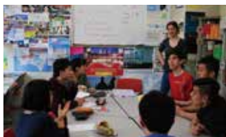
参加者の皆さんにイタリアのスイーツを紹介する〇〇さんと〇〇さん。