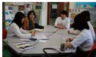
中国語での自己紹介を説明している留学生の〇〇さん。