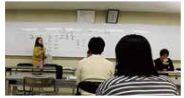
中国語会話教室の様子

2018年度の中国語会話教室は全5回、英会話教室は全3回で、2018年12月から2019年2月初旬まで実施しました。