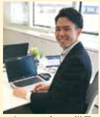
オフィス内での様子

氏名：[ ]さん 卒業年度：2017年3月 学 科：英米 ICC 企業名：関西エアポート株式会社 部署名：航空営業部 入社年数：2年 仕事内容：航空系データ分析