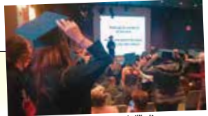
語学学校の卒業式