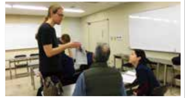
英会話教室の様子