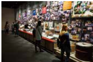
阪神・淡路大震災のパネル展示