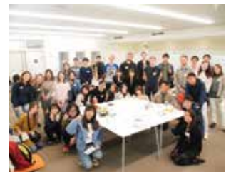
その後の懇親会の様子