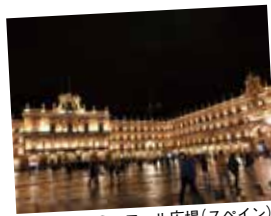
サラマンカのマヨール広場(スペイン)