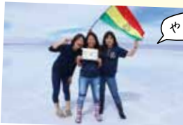
ボリビア ウユニ塩湖にて