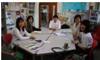
初対面なのにすぐに打ち解けた中国語チャットの参加者。