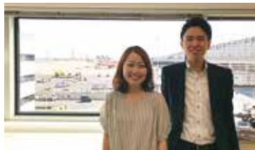
友人で先輩になった!?国際関係学科 [ ]さん(2018年3月卒業)と。

何ヶ月も準備して挑んだ第1志望に1次面接で落ちた一方、滑り止め程度で受けた会社から内定をもらったりと、就活は必ずしも努力に比例するわけではないと思いました。恋愛と一緒にですね！笑