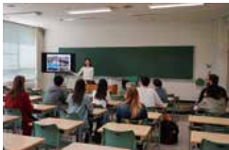
午前中は防災に関する知識を

4月18日(木曜)、2019 年度春学期の新入 JLP 生を対象とした防災・健康管理オリエンテーションを実施しました。午前中は学内で日本語プログラムの教員から日本で起こり得る地震や台風などの自然災害に対する備えや日本の気候についての説明を受けた後、午後は1995年の阪神・淡路大震災での被害や後災、防災・減災について、より知識を深めるため、人と防災未来センターを訪れました。