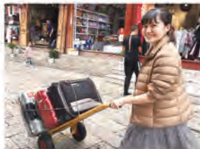
こちらもボランティア中の1枚。古城内ではスーツケースが引きにくいのでお客様の荷物を最寄り入り口まで運びます。