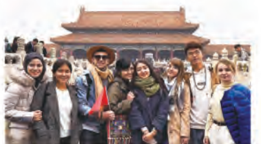
天津外国語大学の友人たちと北京へ。故宮はいつ見ても圧巻です。

留学前にどれだけ計画を立てていても、開始直後はうまくいかないことの方が多いと思いますが、そこで必要以上に落ち込むのではなく、その失敗も終わってからはネタになると思いながら、切り替えて新しいことにどんどんチャレンジしていきましょう!日本にいと中国の悪いイメージのニュースをよく見ると思いますが、中国は人も景色も文化もとっても魅力的です。