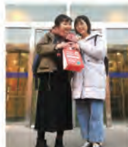
帰国当日一番仲の良かった友人が見送りに来てくれました。