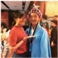
友人が参加する京劇部の公演を観に行きました。私も体験講座で少しやってみました。本当に発音・動き全てが難しかったです…。