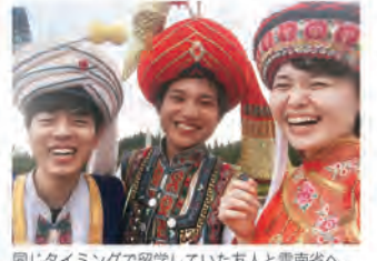
同じタイミングで留学していた友人と雲南省へ。レンタル料500円だったので半ば無理矢理着せました(笑)