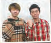
僕たちも今号でラスト！

僕の5年間も振り返って、この広報誌の取材やオープンキャンパスの運営を通じて外大がより好きになったし、学科学年の垣根を超えてたくさんの人と仲良くなることができました！出会った全ての人に感謝です！今まで本当にありがとうございました！！(第2部英米学科■■■■さん)