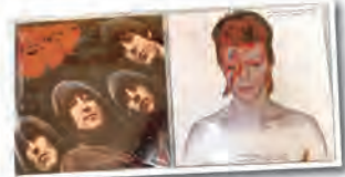
お気に入りのビートルズの「Rubber Soul」(左)とデヴィッド・ボウイの「Aladdin Sane」(右)

大学生は時間に余裕があることもあり、もともとの趣味や、大学に入ってから始めたものを思う存分楽しむことができました。特に音楽を聴くことと、絵を描くことについては、たくさん時間をかけて知識や技術を深めることができました。