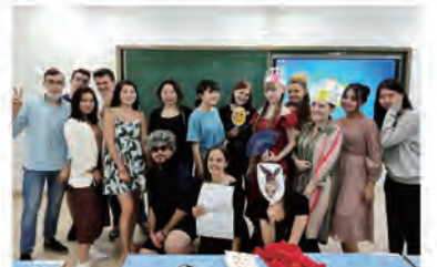
スピーキングテストでは寸劇のテストがありました。