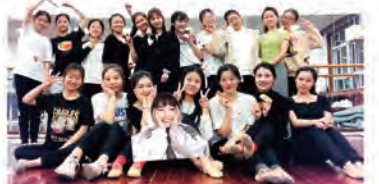
民族舞踊部の部員と。初心者なのに丁寧に教えてくれたおかげで1年間続けることができました。