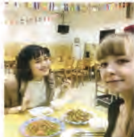
前期によく一緒にいたクラスメートと食堂のレストランへ