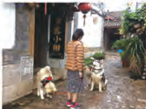
ゲストハウスでのボランティアではアラスカ犬3匹の散歩も仕事の1つ。(これが1番きつかったです)

あとは夏休み中のチェックアウトで少しハプニングが。その時期に寮の管理会社が変わったので、荷物は置いていけるはずだったのに、退寮前日に一転、荷物を管理する場所がないからダメだと言われました。結局友人の部屋に置かせてもらえるようになったのですが、あの時は結構バタバタしました。夏休みにチェックアウトをする際は事前に確認しておくことをお勧めします。