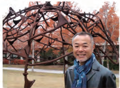
後ろにあるのが「風の道」