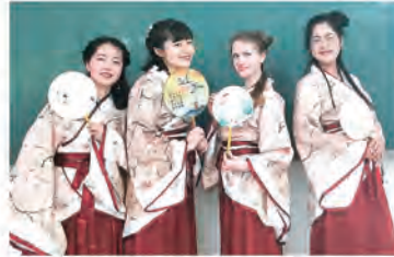
朗読大会の決勝では漢服を着ました！

外国語大学ということもあり、相互学習への理解があると感じました。日本語学科の学生のレベルもとても高く、3年生となれば基本会話は問題ありません。また天津は中国国内でも比較的治安が良く、北京や上海とは違って生活リズムがゆっくりとした印象です。とても過ごしやすい環境だと思います。特に天津外国語大学のキャンパスは天津の市街地にあるので、地下鉄やバスにも困りません。天津外国語大学は日本人は多いですが(私がいたときは60人程いました)、本学から行く人は本当に少ないです。