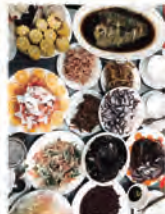
年越しは天津で働いているロシアの友人の職場で。ロシアと中国の食材が並びます。