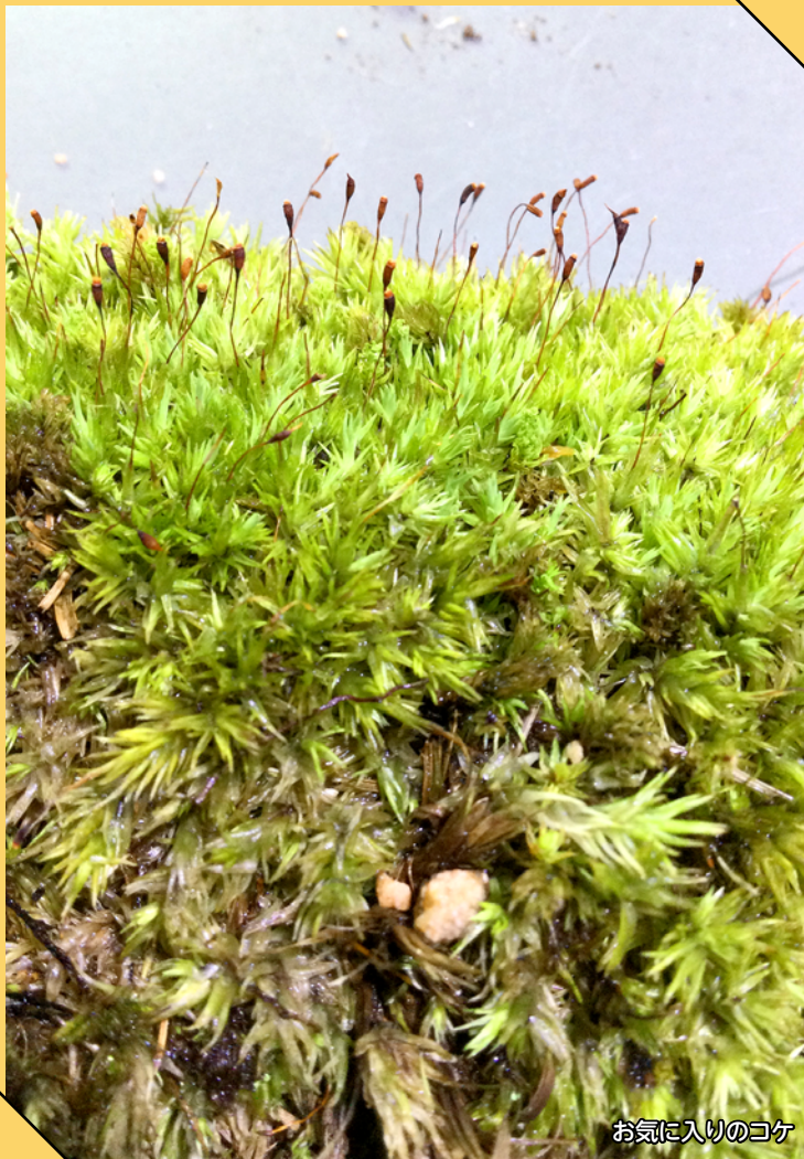
お気に入りのコケ

大学は何をするにも自由なところですよ。いろんなことに興味を持って、共に学べる友だちを見つけ、有意義な学生生活を送ってください。