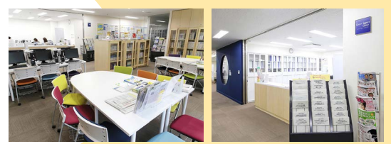
キャリアサポで、最新の就活本、TOEIC対策本を借りれるよ。(ひとり3冊、2週間)

TOEICを受けておこう。高スコアは本番でアピールできるよ。筆記対策も早めにやっておくといいね。