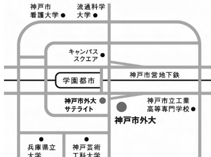
〈学園都市駅周辺地図〉