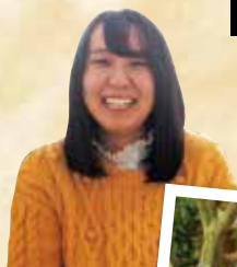
■■■■さん (国際関係学科3年)