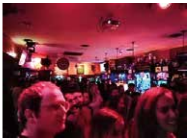
留学生交流イベント カラオケナイト

留学生が参加できるアクティビティに参加したときの写真。友達作りに最適なイベントがたくさんあるので、時間があるときは参加していました。