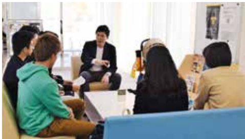
講演後の座談会の様子