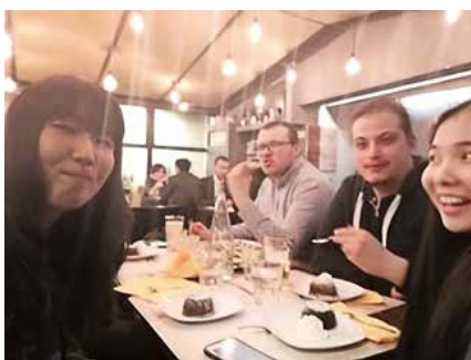
ローマ最後の夜に、向こうでできた日本人の友達とディナーでの1枚。

インスタント味噌汁等の日本食。日本食はほとんどアジアンマーケットで手に入るの心配しなくても良いと思います。特にインスタントの味噌汁は他の日本人もたくさん持っていたりして、思ったより現地で入手できる機会が多かったです。