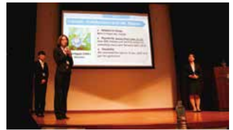
外大の出場チーム「Meets Beats」のプレゼンの様子

今回は「新たな書(描)く文化の創造～Kobe INK物語のマーケティング～」というテーマに対して、10大学18チームが予選に応募し、決勝大会には本学・亜細亜大・関西大・公立鳥取環境大・法政大の5大学8チームが出場し、リサーチやプランニングに基づき熱のこもったプレゼンテーションを行いました。優勝は法政大学の「Sotobori Green」、2位は鳥取環境大学の「Team Kakiko!」、本学からはチーム「Fruits Basket」が3位に入賞しました。