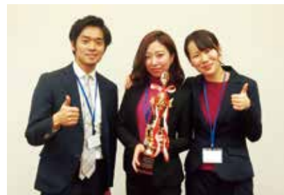
3位に輝いた外大チーム「Fruits Basket」 左から XXXXXXXXXX さん、 XXXXXXXXXX さん、 XXXXXXXXXX さん (全員第2部英米学科4年)