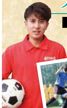
■■■■さん (イスパニア学科1年)