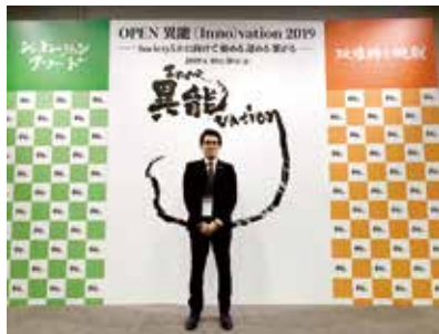
授賞式に参加する[ ]さん