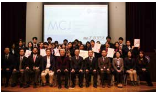
表彰式後の記念写真