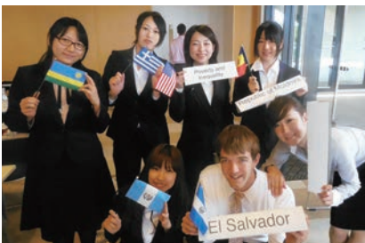
JUEMUN（日本大学英語模擬国連大会）

会社の文化として、積極的な発言や多数の意見の取りまとめが求められるので、自分の意見を考えて、整理し、それを発信するスキルを神戸市外大で身につけることができたことが今に活かされているなと感じます。 今は東京の本社で勤務（新型コロナウイルスの流行が始まってからは完全在宅ワークしていますが、ゆくゆくは海外に赴任し、グローバルに活躍できるような存在になりたいと思っています）。