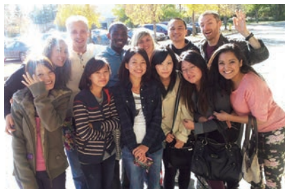
レジャイナ大学での交換留学