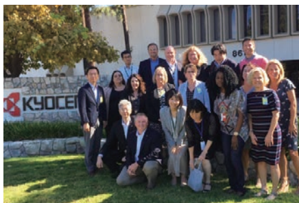
米国現地法人での研修

コロナウイルスの蔓延もあり、社会のあり方や人々の働き方は急速に変化しています。また、ダイバーシティ&インクルージョン*やグローバル化の動きは、今後さらに加速していくでしょう。このような激動の時代の中で、人の働き方にかかわる仕事、とりわけ人事に求められる役割はますます重要になっていくものと感じています。人事パーソンとして、このような動きに柔軟に対応し、「人」の側面から事業に貢献できる人材になることが目標です。