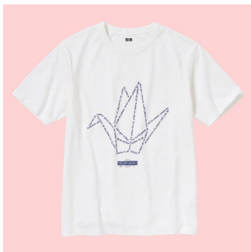
今回寄贈するオリジナル T シャツ (※非売品)

T シャツは、着る人の思いを表現し、それを分かち合うことができる素晴らしいアイテムです。ユニクロは、「世界の平和を心から願い、アクションする」という趣旨に賛同した著名人の方々にボランティアでご協力をいただき、それぞれの平和への願いをデザインした T シャツを販売するチャリティプロジェクト「PEACE FOR ALL」を、2022年6月から展開しています。今回寄贈する T シャツは、「PEACE FOR ALL」のプロジェクトの一環として、製作しています。11月23日(水)には、贈呈式も実施する予定です。