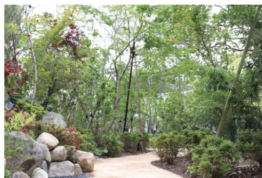
写真 3: 竹チップを使った園路(神戸市 2023)

加えて、竹には温度上昇の抑制効果がある。福岡県のある公園で行われた測定では、竹を細かく砕いた「竹チップ」を用いて舗装された路面がアスファルト舗装された路面に比べて最大で約8℃、平均でも約5℃、温度が低かった(藤川ほか 2009)。神戸市内で行われている「都心・三宮再整備」プロジェクトにおいても、神戸市北区の「竹チップ」が1トン使用され、地産地消の取り組みともなった(写真3)。