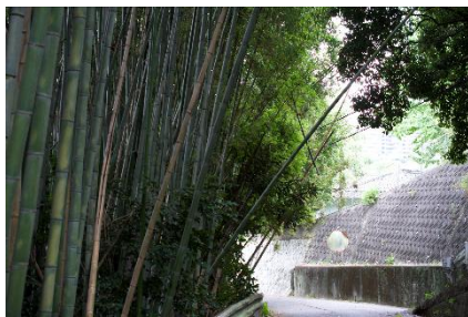
写真 6:白川の放置竹林

放置竹林は、地滑りや倒竹などによる土砂災害の誘発、景観の悪化、他の植物の生育を妨げることでの生態系への影響、農作物への被害といった問題を引き起こす。さらに、道路まで伸び切った古い竹が放置されていると、倒竹の際に通行の危険となる(写真 6)。近年、プラスチック製品の普及、安価な竹の輸入増加、担い手減少による放置竹林の増加などが生じており、竹の良い性質を活用するためには適切な管理が必要だ。