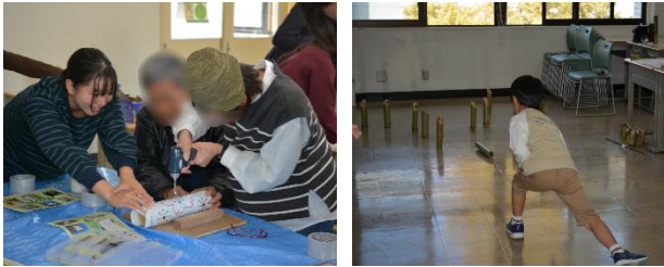
写真 4&5:学祭当日の様子(筆者撮影)

本研究では、須磨区白川を拠点に、放置竹林の管理と竹素材の利活用を通してゼロカーボン社会の実現に寄与し、その効果を測る。2025 年秋に開催された外大の学祭においては白川の竹を使用した竹あかり作りと竹モルック体験のワークショップを実施した(写真 4&5)。外大生と多くの市民の方々60人ほどが参加し、「環境に配慮した良い企画」や「モルックが転がる音に日本らしさを感じた」などの感想が寄せられた。