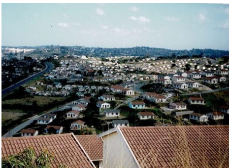
写真4:ダーバン郊外のインド人居住用フラット

インド人移民労働者の中では、サウキビ農園からの離脱や都市部の雑業への転換も生じた。この動きは、確実に、地域社会の多様性と機能性を高めたが、植民地体制側に想定された枠組みからの「逸脱」であり、「白人」側から管理・抑制する動きが生じた。1900 年代からガンディーが南アフリカで組織した抵抗運動も、こうした人種差別主義と対峙したものだ(大石 2015)。ダーバン市外縁部に居住するインド人を強制的に排除する措置はアパートヘイト体制の集団地域法(1950 年)によって行われた。市郊外の特定地域(チャッツワースやフェニックスなど)がアジア人の集団地域とされ、インド人はそこへの強制移住を余儀なくされた。行政当局は、こうした郊外の丘陵地に世帯用の簡易なフラットを用意してインド人を収容し、標準化された家が延々と点在する特異な光景を現出させた(写真 4)。