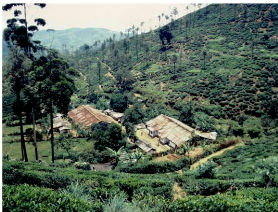
写真1 スリランカの茶園における長屋

「ライン(line)」は、茶園労働者の家族世帯用の小部屋を横に連ねた長屋を指す呼称で、一列のシングル・ラインと二列分