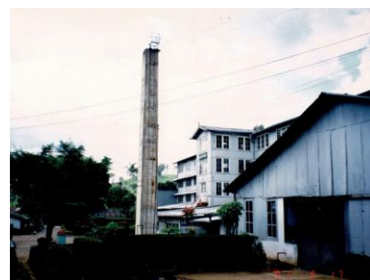
写真2 スリランカ茶園の中核部の加工工場

紅茶園は、事業主、中間管理職、労働者という階層性が人種・民族的識別と連動して厳然と区分されてきており、それが、物理的な空間配置を伴う社会空間としても現出してきた。植民地期には、農園の中核部で、イギリス人などの西欧系の事業者(プランター)が住まうバンガロー(西洋と現地の様式/伝統を折衷したコロニアルスタイルの邸宅)が小高い丘などに配置され、その下方に、加工工場や中間管理職の事務職員の住居が設けられた(写真2)。他方、インド人労働者の長屋住居は、広大な茶樹地域の只中に、中核部との物理的/社会的な隔絶性の中に配置された。加えて、園内ではジェンダー的な規範/階層性も埋め込まれた。事業主から管理職、カンガーニまで、園内業務を取り仕切るのは男性で、その下で、日々の茶摘み業務を行うのはインド人女性労働者となった。総じて、園内では、人種/民族の階層性と相俟った固有の家父長制が複合的に機能して、事業者男性をトップとする男性主導の階層的業務管理、家父長が束ねる労務、勤勉で従順な移民女性労働力の再生産が歴史的に続いてきた(Jayawardena & Kurian 2015)。