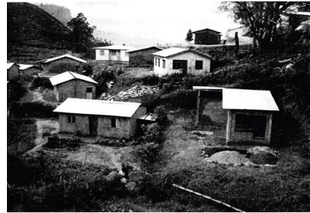
写真 5: スリランカ茶園内の新設フラット(大石美佐 2001)

き起こしている。セイロン茶葉を大量に買い付けている日本(キリン社「午後の紅茶」など)にも影響が大きい。こうしたことを背景にして、インド人労働者の生活改善策が導入されてきた。住宅に関しては、1990 年代前半にエステート労働者住宅協同組合による世帯用の戸建てフラット建設用資金の低利貸し付けが始まり、長屋に代わるものとして建設が進められた(大石美佐 2001)。長屋は、2000 年代初頭でプランテーション内の住宅の 6 割程度となり、低下傾向を見せ始めたが(Sri Lanka 2001)、トイレや給水など基本的な生活条件に大きな課題を残している。